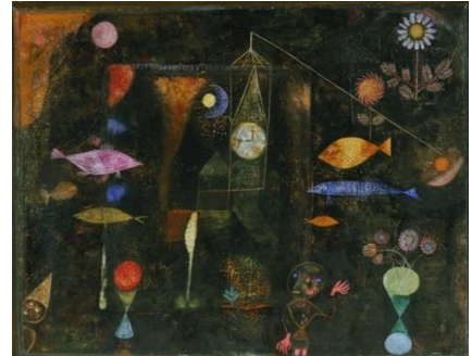
Kunstwerk Paul Klee

Eerst hebben ze lijnen getrokken met gekleurde verf. Daarna hebben ze dieren getekend met een zwart krijtje. Toen moesten ze met zwarte inkt de rest van het schilderij zwart verven. Dat was best spannend! Het kunstwerk werd afgemaakt met mooie gekleurde papiertjes.